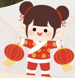
外來探訪 中大同行之友愛鄰社