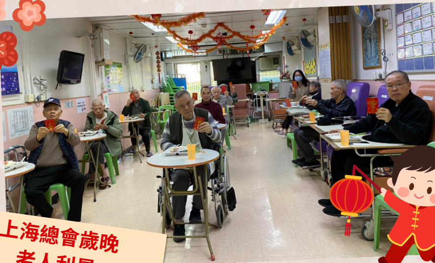
上海總會歲晚 老人利是