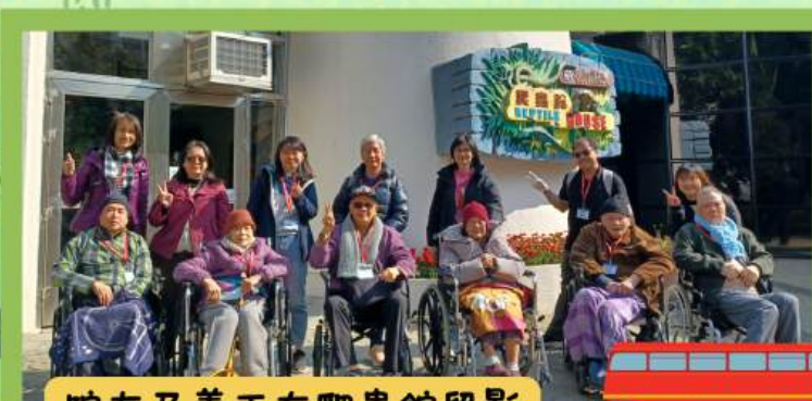
院友及義工在爬蟲館留影