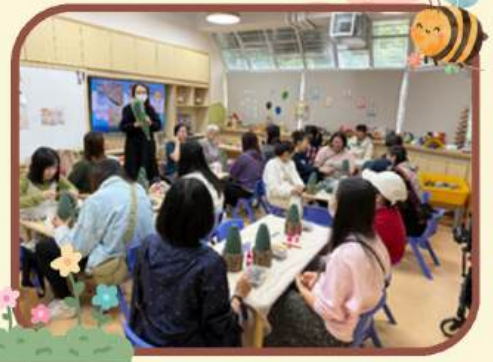
「花之蜜語」 聖誕樹永生花家長工作坊