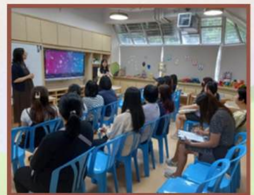
「快樂孩子快樂父母：建立優質親子關係」家長講座

一系列由社工舉辦的家長講座及工作坊，讓家長認識建立良好親子關係、生活習慣對幼兒發展的重要。同時提升家長的教顧技巧，自我關顧和覺察情緒的空間，促進家長對情緒管理的認識，也加強與學校之間的聯繫，共同促進孩子的健康成長。