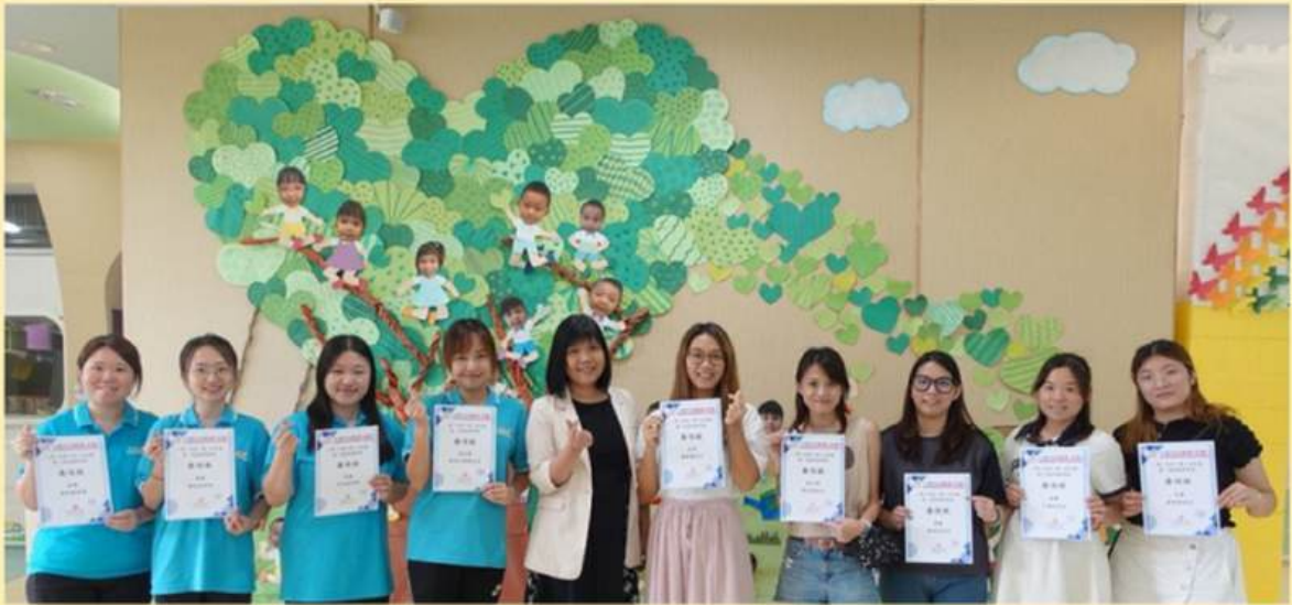
第一屆家長教師會家長委員及教師委員

本園於2023/2024學年正式成立第一屆家長教師會，以加強學校與家長之間的溝通，建立夥伴合作關係，共同促進幼兒各方面的發展。