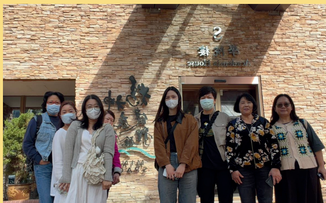
到訪青山醫院精神健康體驗館