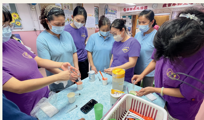
以流動測試評估飲品加入凝固粉後的濃稠度